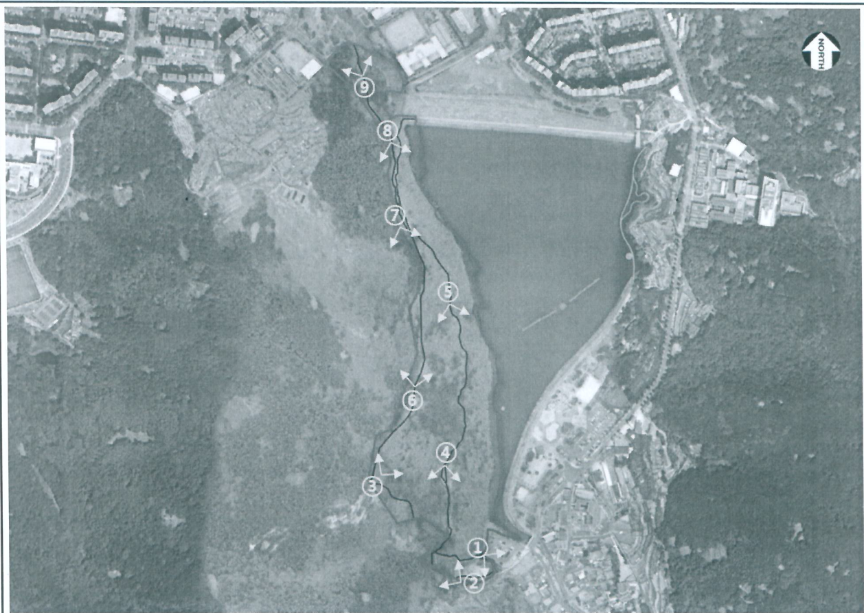
① 산책로 남측입구