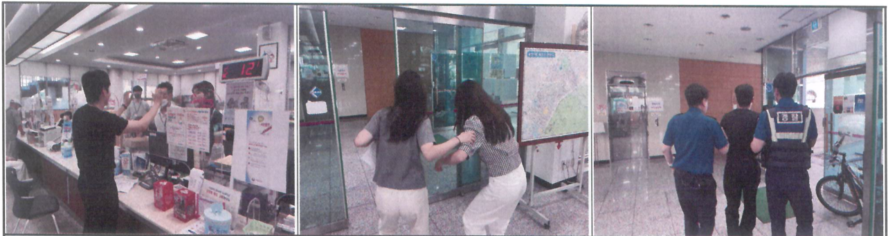
특이민원 발생 ▶ 경찰 호출 ▶ 피해공무원 보호 및 민원인 대피 ▶ 가해 민원인 제압 ▶ 경찰 인계